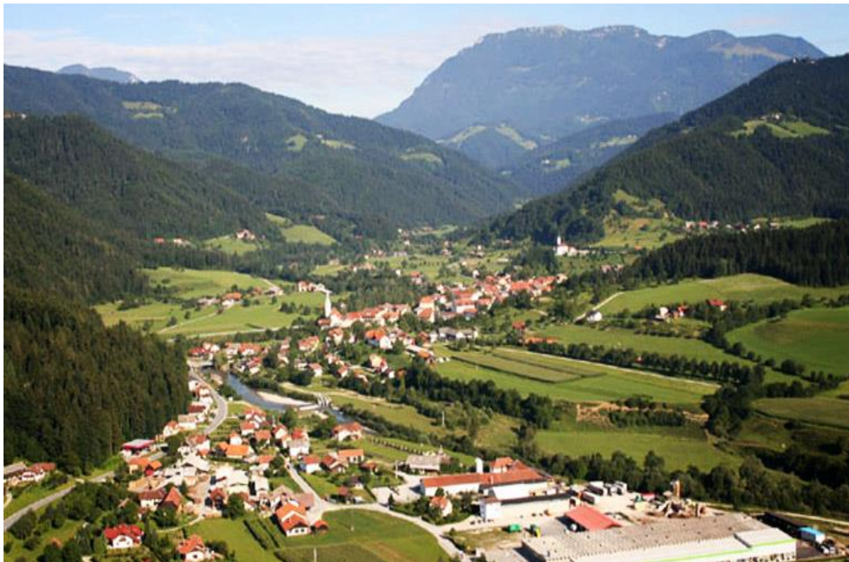
Slika 2: Občina Ljubno